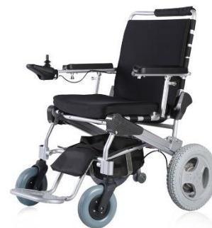
12" roues à l'arrière GM-ET-12F22 Brut 4835.00

Modifications réservées, prix de vente en CHF, incl TVA