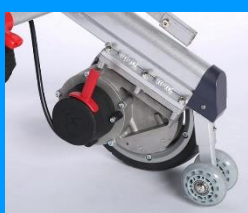
Moteur au moyeu de roue :

Modifications réservées, prix de vente en CHF, incl TVA