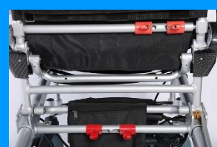
Réglage du dossier et pliage