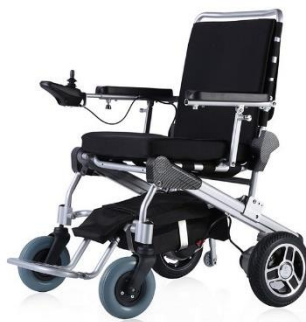
10" roues à l'arrière GM-ET-10F22 Brut 4480.00