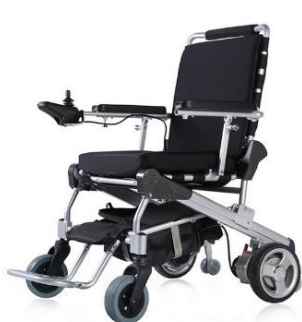
8" roues à l'arrière GM-ET-08F22 Brut 4221.00