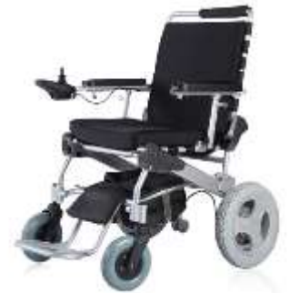
ET-12F22 12" Antriebsräder GM-ET-12F22 VP 4835.00