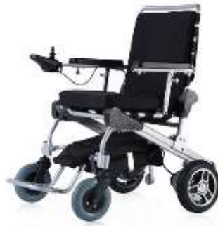
ET-10F22 10" Antriebsräder GM-ET-10F22 VP 4480.00