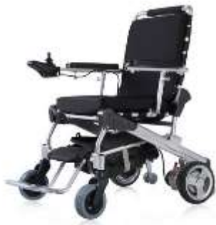
ET-08F22 8" Antriebsräder GM-ET-08F22 VP 4220.00